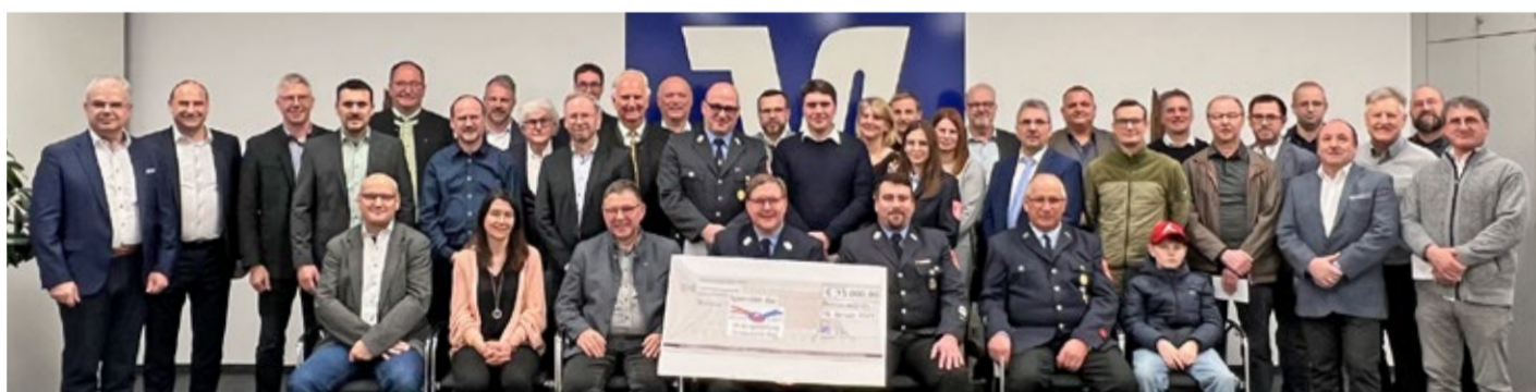
Symbolische Scheckübergabe in Donauwörth.